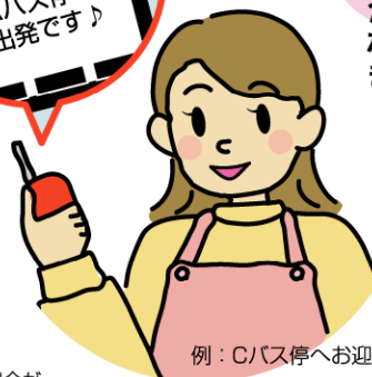
例：Cバス停へお迎えのお母さん